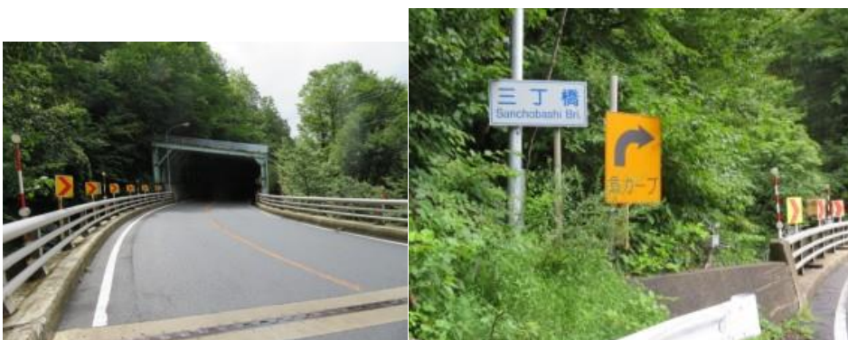
※1番目の洞門、三丁橋

③9時59分、檜沢橋を渡ると万歩計で296歩ある一番目洞門を10時より通過する。この洞門を出ると数台のバイク野郎と対面する。10時5分より117歩ある二番目洞門を通過する。10時6分、三丁橋を渡る。