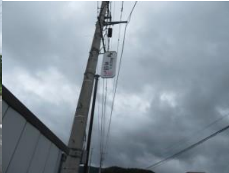
※猿ヶ京温泉交差点、本伝案内