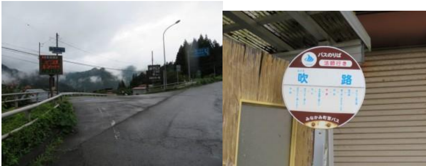
※法師温泉への交差点、吹路バス停

⑫12時51分より、255歩ある新三国大橋(赤橋)を渡る。12時55分、東京から171km地点に到達。この橋を渡り、暫く歩くと猿ヶ京の民家が広がる。