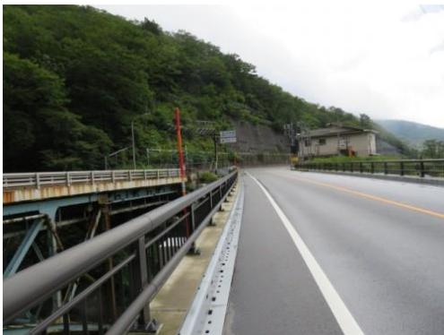
※新三国トンネルを出ると群馬県となる

③9時59分、檜沢橋を渡ると万歩計で296歩ある一番目洞門を10時より通過する。この洞門を出ると数台のバイク野郎と対面する。10時5分より117歩ある二番目洞門を通過する。10時6分、三丁橋を渡る。