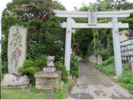
※猿ヶ京バス停、神明神社